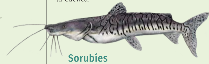
Sorubies Pseudoplatystoma spp 100 cm