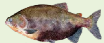
Gamitana Colossoma macropomum 40-100 cm

Hasta 3.700-5.500 km aguas arriba es la distancia que puede recorrer un bagre del género Brachyplatystoma en su migración desde el estuario, su área de crianza, hasta el pie de los Andes, donde desovan.