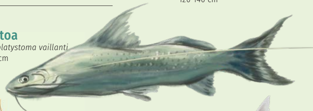
Manitoa Brachyplatystoma vaillanti 40-100 cm