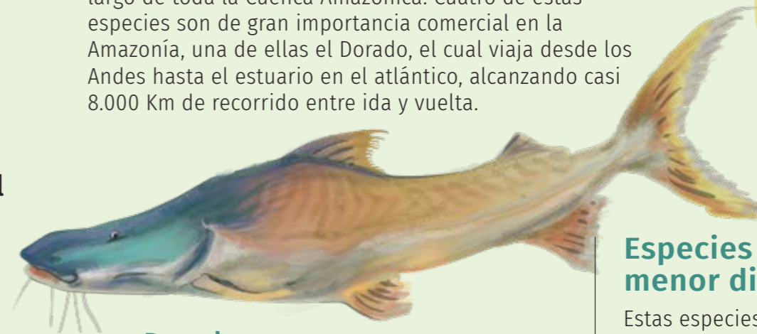
Dorado Brachyplatystoma rousseauxii 120-140 cm

Estas especies realizan migraciones menores, de entre 100 y 1.000 km, con fines reproductivos o de alimentación. Al igual que los grandes bagres, son de gran importancia comercial a lo largo de toda la Cuenca.